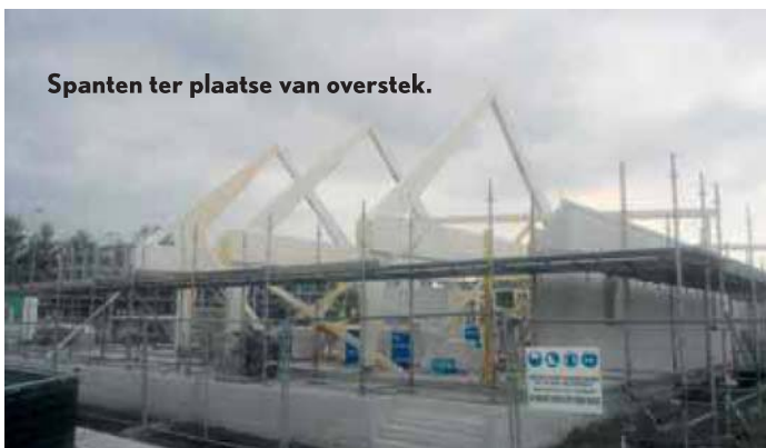
Spanten ter plaatse van overstek.