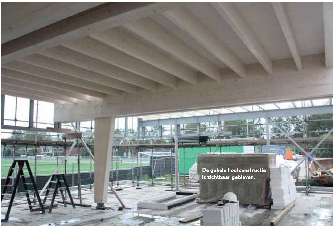
De gehele houtconstructie is zichtbaar gebleven.